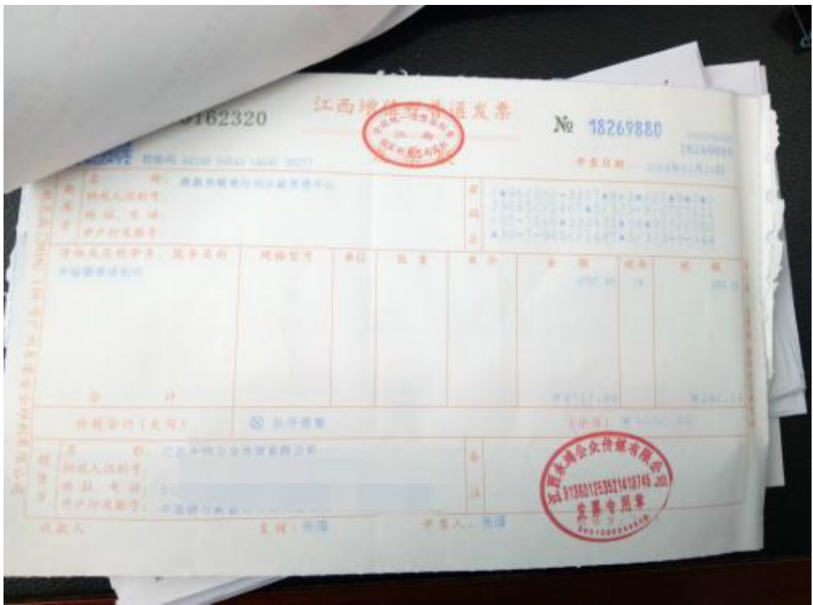
票据照片 4 (版式设计)