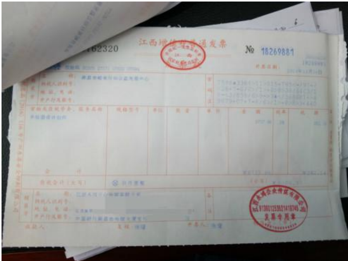
票据照片 3 (手绘图创作)