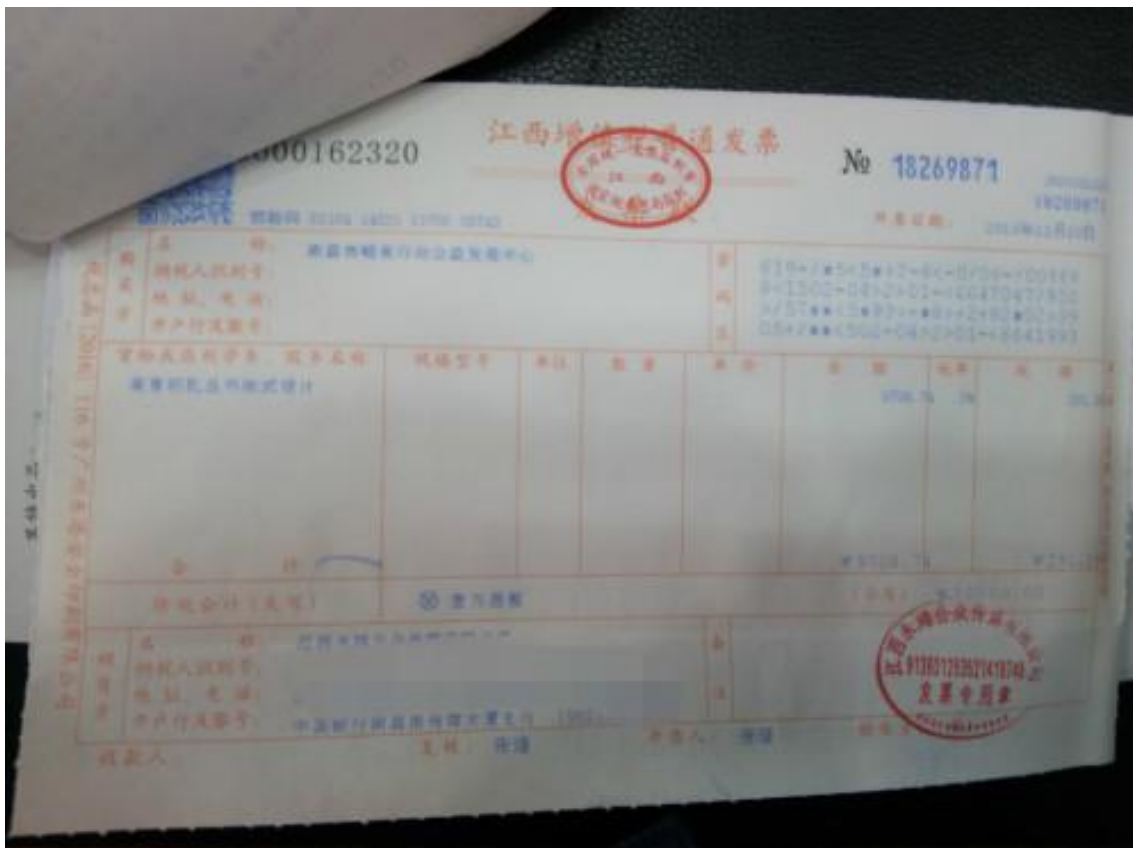
票据照片 5 (印刷费)